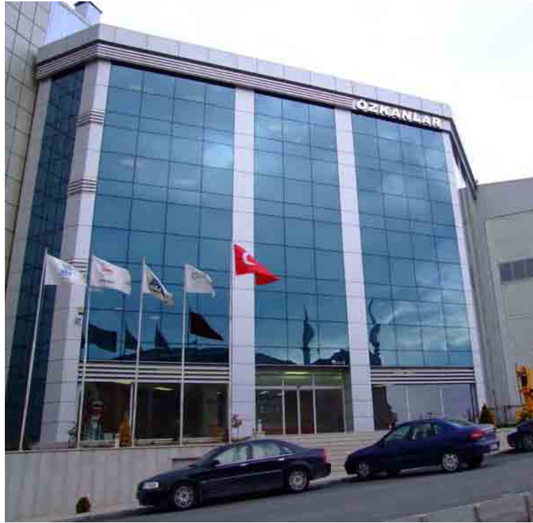
Yönetim ve Üretim Binasımız