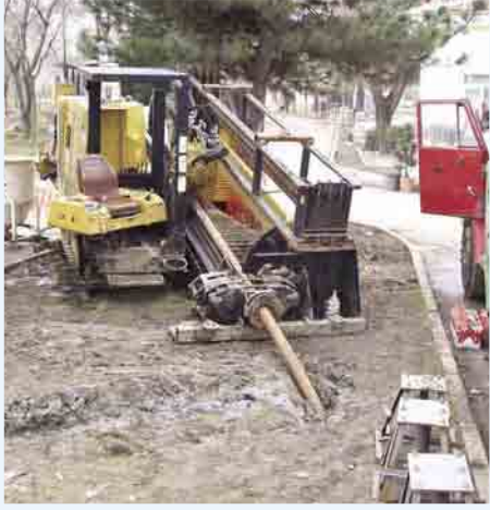
Yatay Sondaj başlangıç noktası