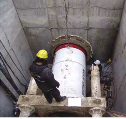
Başlangıç Şaftı - Giriş Noktası