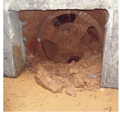
Çıkış Şaftı - Çıkma Noktası