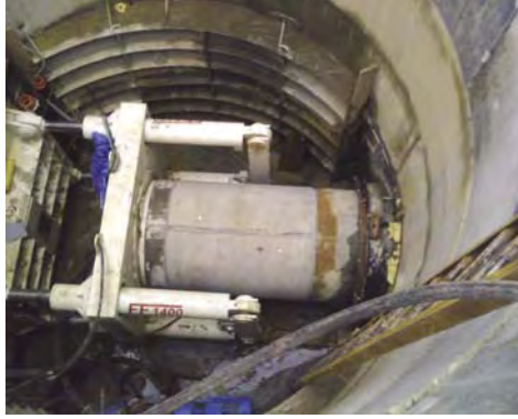
İtme İstasyonu Çalışırken