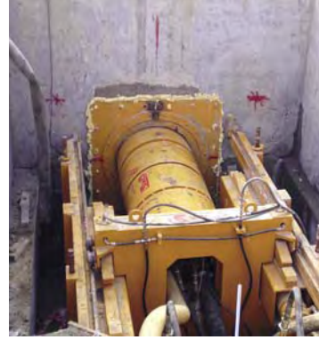
Başlangıç Şaftı - Giriş Noktası