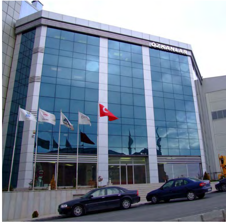
Yönetim ve Üretim Binaımız